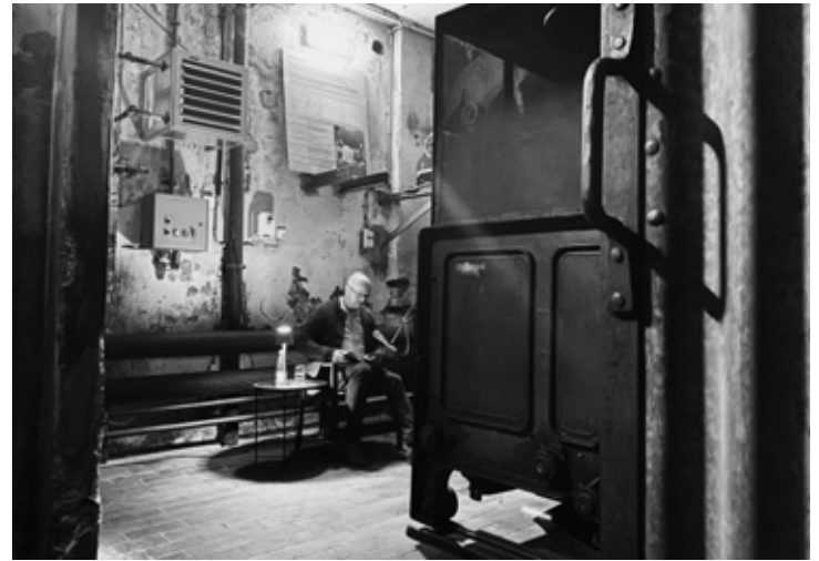
Literarisch-musikalische Überraschungs-Dinner in der Tuchfabrik Gebr. Pfau