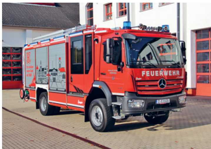
Das neue Hilfeleistungslöschgruppenfahrzeug der Ortsfeuerwehr Crimmitschau.

Am 23. November 2024 wurde der Freiwilligen Feuerwehr Crimmitschau ein neues Hilfeleistungslöschgruppenfahrzeug (HLF 20) übergeben. Mit Gesamtkosten von 550.000 Euro, wovon 194.000 Euro aus Fördermitteln finanziert wurden, ersetzt das moderne Einsatzfahrzeug das bisherige HLF 20, das seit seiner Anschaffung im Jahr 1997 – damals noch unter der Bezeichnung LF 16/12 – im Einsatz war. Das neue Fahrzeug bietet im Vergleich zu seinem Vorgänger zahlreiche Verbesserungen. Besonders hervorzuheben sind die erweiterten Kapazitäten für Löschmittel: Statt bisher 1.600 Litern Wasser können nun 2.000 Liter mitgeführt werden. Auch die Schaumversorgung wurde optimiert: Die früher in Kanistern gelagerten 120 Liter wurden durch einen fest verbauten 200-Liter-Tank ersetzt.