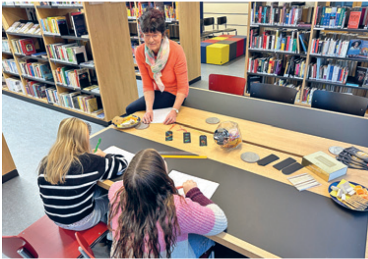
Basteln in der Stadtbibliothek

Ein weiterer Höhepunkt war das literarisch-musikalische Überraschungs-Dinner in den Wollkammern der historischen Tuchfabrik. Inmitten des einzigartigen Ambientes wurde gelacht, gelauscht und geschlemmt. Das Zusammenspiel aus literarischen Highlights, einem köstlichen 3-Gänge-Menü und stimmungsvoller Musik sprach alle Sinne an und wird Gästen wie Mitwirkenden noch lange in Erinnerung bleiben.