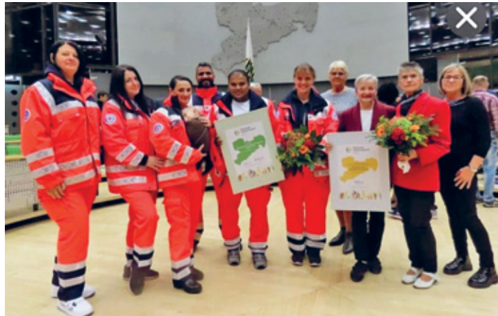
Gruppenfoto der ausgezeichneten Lehrerinnen mit den Preisträgern der Wasserwacht der Koberbachtalsperre Langenhessen

Die Initiative, die von pensionierten Lehrerinnen und Lehrern getragen wird, bietet seit 2015 Deutschkurse für Migrantinnen und