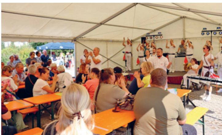
Auftritt des Fanfarenzugs zur Jubiläumsfeier

Am 31. August 2024 feierte die Wohnungsgenossenschaft Crimmitschau eG ihr 70-jähriges Bestehen mit einem bunten Familienfest auf dem Parkplatz der Minigolfanlage. Das Ereignis bot nicht nur Anlass zur Freude, sondern auch zur Rückschau auf eine beeindruckende Entwicklung, die seit der Gründung am 11. August 1954 kontinuierlich vorangeschritten ist. Mit der Eintragung ins Genossenschaftsregister am 25. August 1954 begann die Geschichte der Genossenschaft, die heute aus der Stadt Crimmitschau nicht mehr wegzudenken ist.