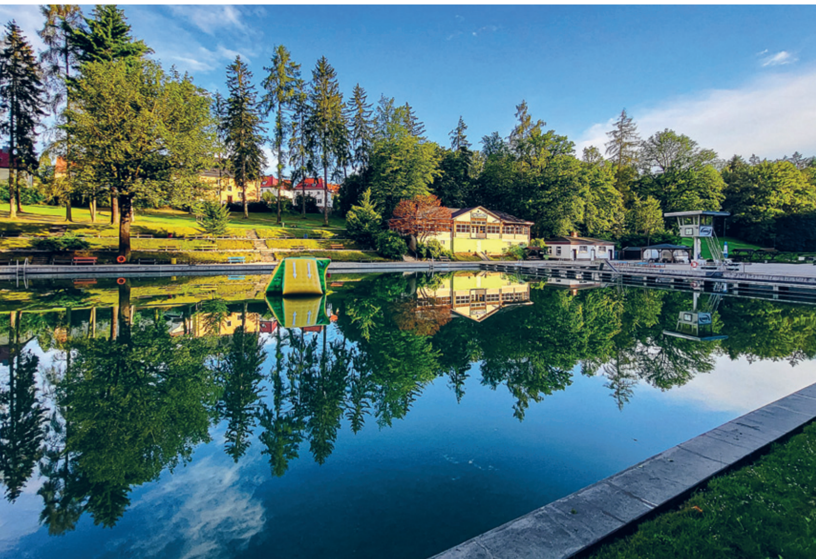
Blick in das Sahnbad