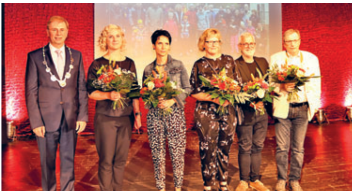
Auszeichnung des Fördervereins Tiergehege Crimmitschau e.V.