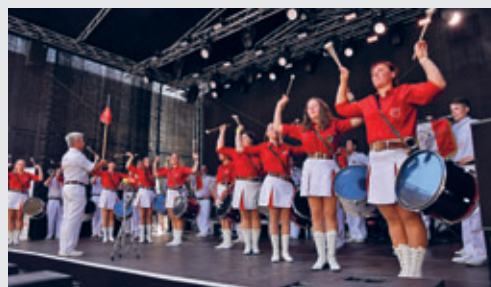
Auftritt des Fanfarenzuges Crimmitschau zum Marktfest

Im Juli 2023 treffen sich Sachsens Spielleute in Crimmitschau zur 33. Landesmeisterschaft des Landes-, Musik- und Spielleutesportverband Sachsen e.V. Die Planungen für dieses Event laufen bereits seit 2018 und standen damals im Zeichen des 60. Gründungsjubiläums des Crimmitschauer Fanfarenzuges, welches ursprünglich 2020 gefeiert werden sollte. Die Corona-Pandemie verzögerte jedoch die Umsetzung. Aktuell werden Spielmannszüge mit rund 400 Musikern erwartet. Die Fanfarenzüge aus Markkleeberg, Neukirchen