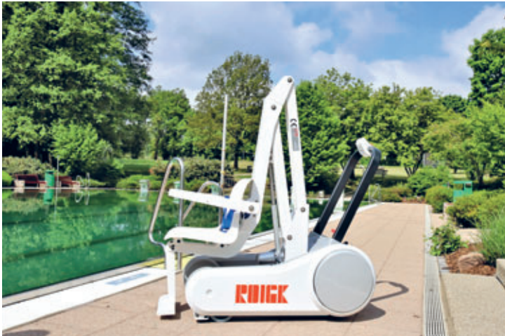
Schwimmbadlift im Freizeit- und Erlebnisbad Mannichswalde

Am Freitag, dem 26.05.2023, starteten das Freizeit- und Erlebnisbad Mannichswalde sowie das Sahnbad in die diesjährige Badesaison. Das Freizeit- und Erlebnisbad Mannichswalde ist ein echtes Familienbad. Drei Bäderbecken, eine 100-Meter-Großrutsche, eine Familienrutsche und ein Sprungturm warten auf alle Badelustigen. Ein großer, gebührenfreier Parkplatz direkt vor dem Bad erleichtert auch Familien mit kleinen Kindern und viel „Badegepäck“ eine stressfreie Ankunft. Personen mit Behinderung können ab sofort einen besonderen Service nutzen: Ein Schwimmbadlift dient als Einstiegshilfe. Außerdem steht für Camper der Drei-Sterne-Campingplatz zur Verfügung. Auf sehr gut ausgestatteten und gepflegten Grünflächen befinden sich 38 Stellplätze für Wohnwagen, Wohnmobile und Zelte. Moderne Sanitär- und Nebenanlagen gehören zum Standard. Schwimmlehgänge finden während der Sommerferien von Montag bis Freitag, jeweils um 9 Uhr, statt. Interessenten melden sich bitte unter Tel. 036608 2514.