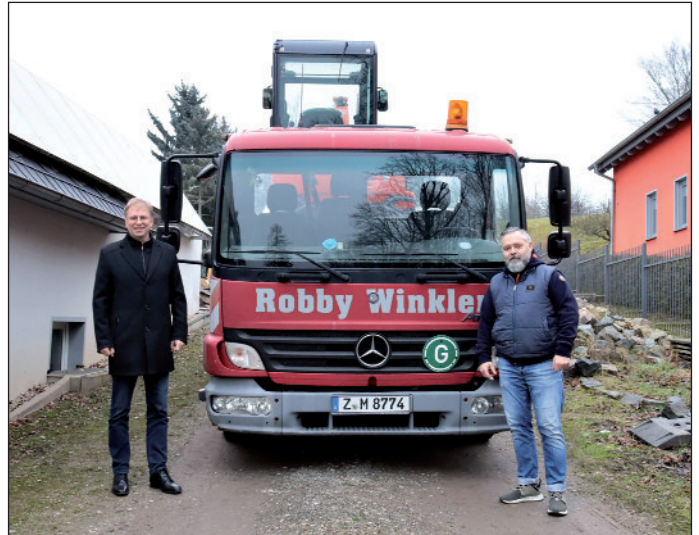
Oberbürgermeister André Raphael (links) und Robby Winkler (rechts)

Besuche zu Firmenjubiläen nimmt Oberbürgermeister André Raphael auf Einladung oder nach Absprache mit den, in der Unternehmensdatenbank der Wirtschaftsförderung, eingetragenen Unternehmen wahr. Das Anmeldeformular für die Unternehmensdatenbank befindet sich auf der städtischen Homepage www.crimmitschau.de unter Rubrik Wirtschaft / Unternehmensdatenbank. Der Eintrag ist kostenlos.